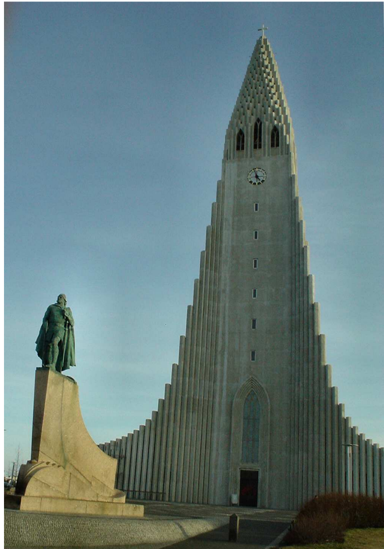
Leif Eiricsson voor de Hallgrímskirkja

De taal is een verhaal apart. Het Oud-Norse werd in die tijd door alle Scandinaviërs gesproken. Wegens het isolement van IJsland bleef dat gedurende 800 jaar vrij stabiel, terwijl de taal in andere landen grote evoluties doormaakten.