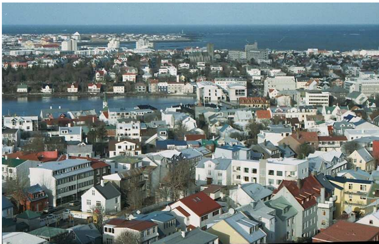
Reykjavík (= Rook + Haven) anno 2011: aan de rechterkant van het meer het Ráðhús, waar er geschaakt werd