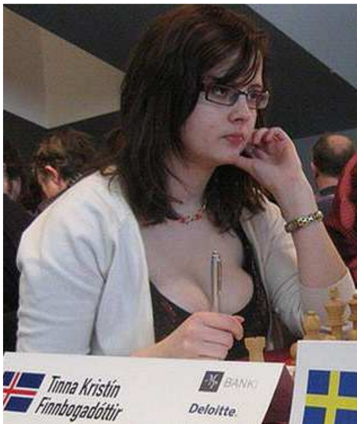
Deze Vikingsdochter werpt al haar wapens in de strijd!