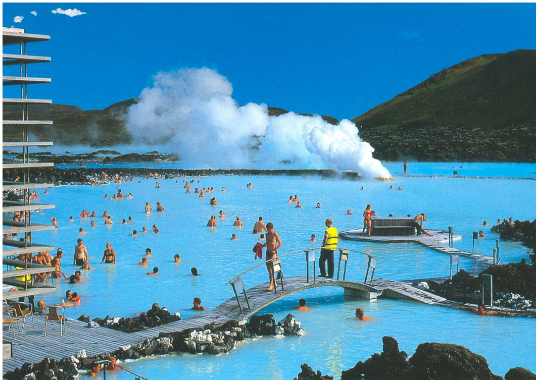
De Blue Lagoon

Slechts een 3% van IJsland heb ik gezien, maar ik kan zeggen dat het er daar overweldigend mooi is. Een deel van de rest hoop ik eens in de zomer te ontsluiten, want dan is het er 10 graden boven nul: de midzomer zon, gletsjers, watervallen, vulkanen, de fjorden, het noorderlicht, walvissen, puffins, enz. enz. Dit smaakt naar meer!