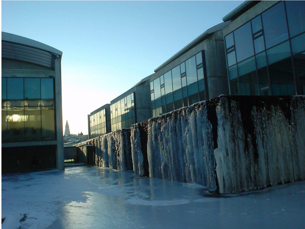
Het Ráðhús met in de verte de Hallgrímskirkja.