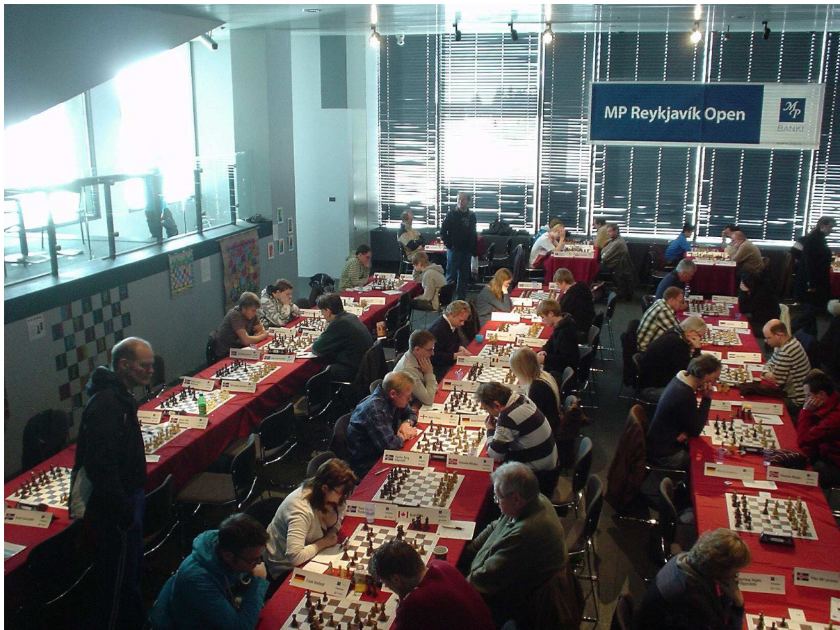
Een klein deel van de speelzaal