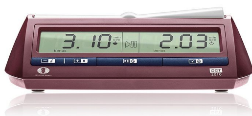
DGT2010 (nieuw model) Herkenbaar aan de blauwe knoppen.