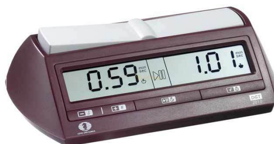
DGT2010 (oud model) Herkenbaar aan de rode toetsen.